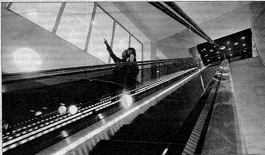
Eskaletory vyvezly první zájemce až do sedmého, nejvyššího patra ke třem kinosálům. Dalších sedm sálů je umístěno v suterénu.