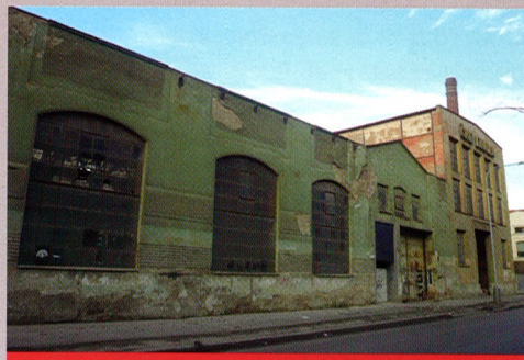
Karlin Hall – before refurbishment

With the new building, eight storeys in all, Marek explains that an appropriate contrast will be effected between the existing and new buildings. "The intention with the new is to create an abstract façade made up of protruding glass lamellas, which suppresses the building's scale." The building will have two underground parking levels. While upper floors will offer office space for rent, the ground level, first floor and first level underground will be used as a multifunctional cultural and social hall for exhibitions, theatre presentations and conferences. "It will be the complex's Event Hall; it will have two levels of decks and will look and function something like Lucerna, or even Archa, as a multi-use space," says Tomáš Kadeřábek, explaining that the idea came from Michaela Maláčová Bakala, who wanted to create an event space for Miss Czech Republic. "As that event is only happening once a year, we decided to create a flexible space that could be used for other cultural events at any time throughout the year."