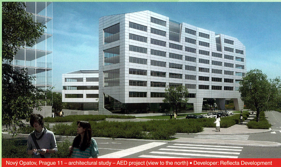
Nový Opatov, Prague 11 – architectural study – AED project (view to the north) ■ Developer: Reflecta Development

“Nový Opatov” has been in the planning stages for more than two years now. The project is currently in the stage of the preparation of the documentation