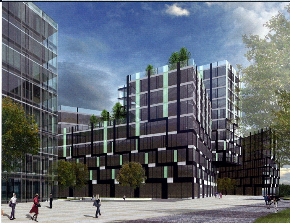
Nový Opatov, Praha 11 – architektonická studie ateliéru SHA (pohled od metra) ■ Developer: Reflecta Development

Zástavba je koncipována do pěti až šesti samostatných celků s možností dalšího dělení na variabilní pronajimatelné prostory podle potřeb budoucích nájemníků. V přímé návaznosti na stanici metra jsou situovány objemnější objekty než na okrajích pozemku, v jehož střední části se má tyčit 15patrová dominanta . Zbytek objektů Nového Opatova dosáhne v průměru osmi až deseti nadzemních podlaží. Parkování je umístěno v podzemních prostorách budov. Výjimku budou tvořit okrajové části na severní a jižní straně území, kde se plánuje menší množství parkovacích stání na terénu pro účely služeb umístěných v parteru. V bezprostřední blízkosti stanice metra pak vznikne veřejný prostor v podobě náměstí . Modernizací projdou také stávající autobusové zastávky při ul. Chilské a vestibul metra. Stanice metra Opatov je frekventovaným přestupním uzlem MHD, který by v budoucnu mohl doplnit také prodloužení tramvajové trasy číslo 11 ze Spořilova směrem na Háje.