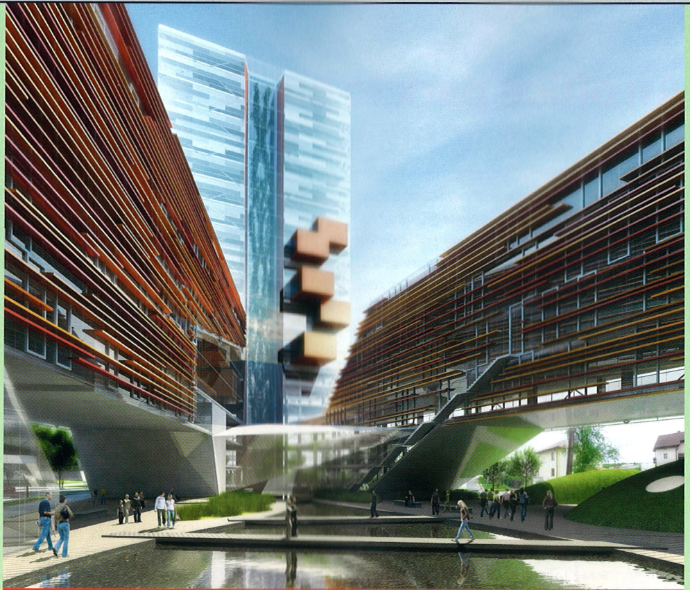
Nový Opatov, Prague 11 – architectural study – GRIDO architects ■ Developer: Reflecta Development