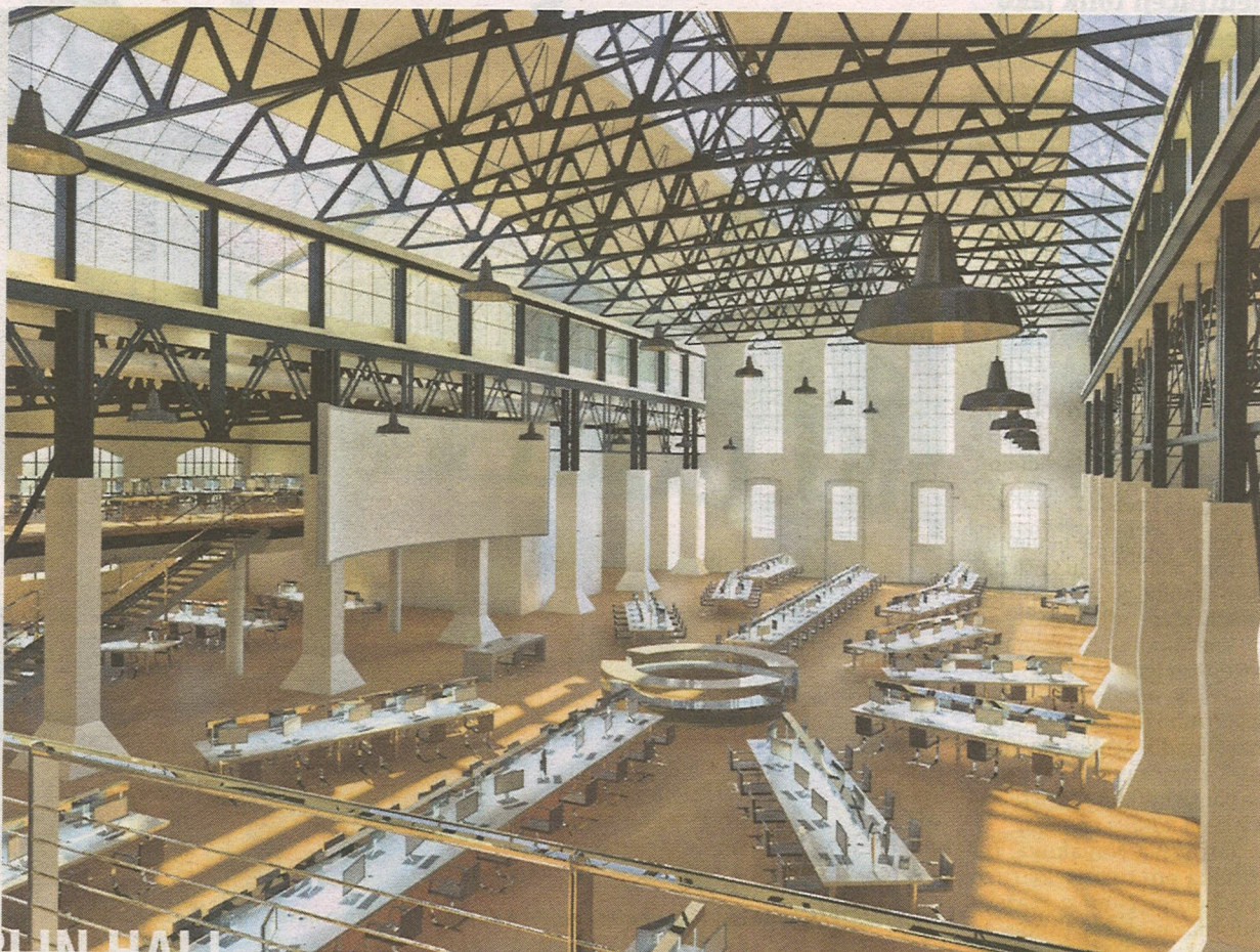
ÚSTŘEDÍ VYDAVATELSTVÍ Po rekonstrukci by se měla hala Kotlárna proměnit v sídlo vydavatelství Economia, které vydává také Hospodářské noviny. VIZUALIZACE: TRESS REAL ESTATE

V rámci druhé fáze vznikne na volných pozemcích nová budova, jejíž součástí bude kromě kancelářských prostor