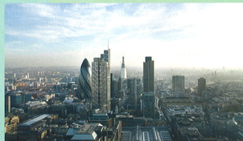
Heron Tower, UK – Best Office and Business Development