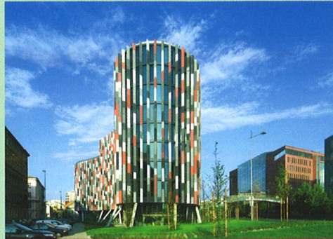
Main Point Karlin, Prague – Best Office and Business Development

Main Point Karlin , which received its final use approval last August has received accolades for its distinctive sustainable architec-