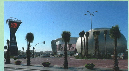
Morocco Mall, Morocco – Best Shopping Centre