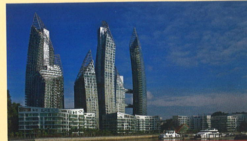
Reflections at Keppel Bay, Singapore – Best Residential Development

Vítězové MIPIM Awards i Ceny veřejnosti budou vyhlášeny na slavnostním ceremoniálu ve čtvrtek 8. března 2012 v 18.30 hodin ve velkém auditoriu Palais des Festivals v Cannes .