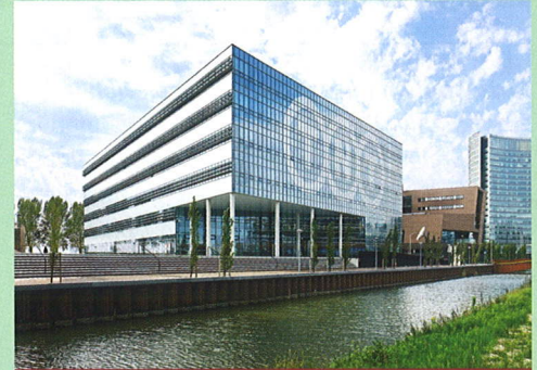
TNT Centre, The Netherlands – Best Office and Business Development

ture and high technological level. Designed by DaM architects in Prague, the 10-storey building is striving to obtain Platinum, the highest level of certification in the LEED system. Situated between the modern buildings along Prague's River Vltava and the historical buildings of the Karlin district, Main Point Karlin, with its organic curves and coloured pilasters, is already a dominant feature on the Prague 8 landscape. It uses a number of approaches in its sustainable design, among them, use of the Vltava's water throughout the summer for building cooling, eliminating the need for compressors and chillers; cooling is further naturally regulated by the coloured pilasters which are not only aesthetic but serve to reduce heat gains from sunlight penetration.