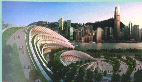
Express Rail Link West Kowloon Terminus, Hongkong – Best Futura Mega Project

All winners, in both the regular competition and new People's Choice competition, will be announced and handed the award at the prestigious MIPIM Awards Ceremony to be held on Thursday March 8, 2012 at 6:30 pm in the Grand Auditorium of the Palais des Festivals in Cannes .